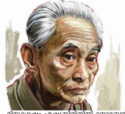
നിറുശേഷം ഏഷ്യയിൽനിന്ന് നൊബേൽ നേടിയ രണ്ടാമത്തെ എഴുത്തുകാരനാണ്. സ്വയം മരണംവരിച്ച അദ്ദേഹം ഏത് വർഷമാണ് നൊബേൽ നേടിയത്- 1968